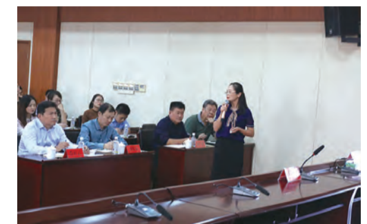
（文/张国堂；图/沈永炬）