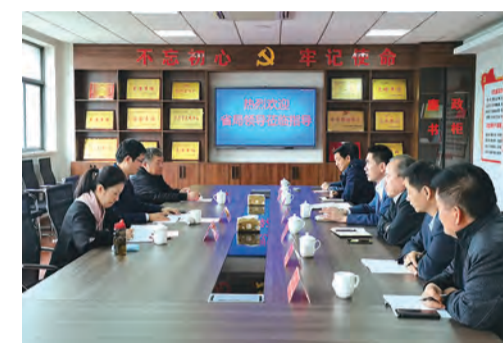
融合表示肯定。就下一步工作，他要求：一要坚持高质量，注重提升发展整体质效，科学谋划十